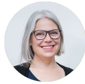
Robin Menges Institut für Beziehungskompetenz